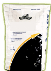
MNV Sverige AB levererar aktivt kol i säckar på 50 liter.